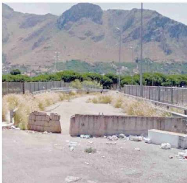
Brancaccio. Una delle rampe per l'accesso agli svincoli

Una storia travagliata Varianti urbanistiche, infiltrazioni mafiose e cavi elettrici: tutti gli stop al cantiere