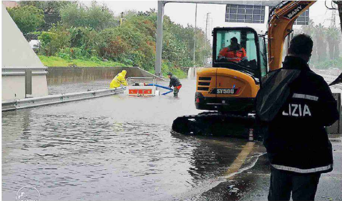
Maltempo. Sono continuati anche ieri gli interventi di assistenza nella zona di Ragusa e Siracusa