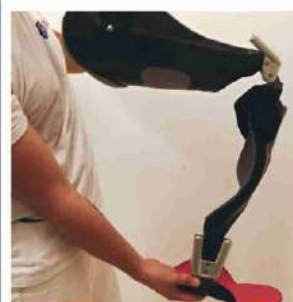
All'avanguardia Una protesi ortopedica realizzata dalla Ro.Ga. di Enna In alto a destra, una sala operatoria dell'Ismett, che fa capo a Upmc Italy