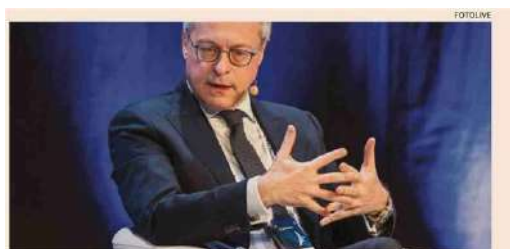
Il 75° de La Provincia di Cremona. Il presidente di Confindustria Carlo Bonomi

Nell'industria i lavoratori in attesa di contratto sono 242.420 su 7 milioni complessivi