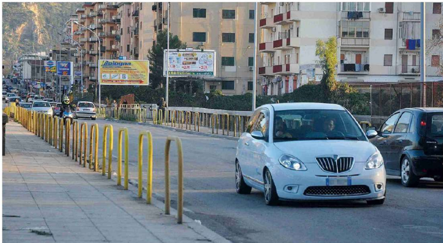
Ponte Oreto. Aggiudicata la gara del primo lotto dell'appalto che prevede il restauro, il risanamento conservativo e il recupero