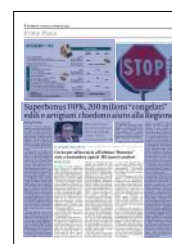
Peso: 1-6%, 4-65%